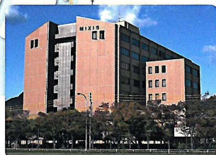
広島ミクシス・ビル